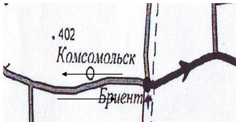
Схема маршрута школьных регулярных перевозок учащихся, осуществляемых МАОУ «Бриентская средняя общеобразовательная школа». автобусом ПАЗ 320538*70, гос. номер: С268УН56